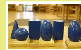
Arbeit mit Montessorimaterial

Remscheider Str. 239 42855 Remscheid 02191-28074